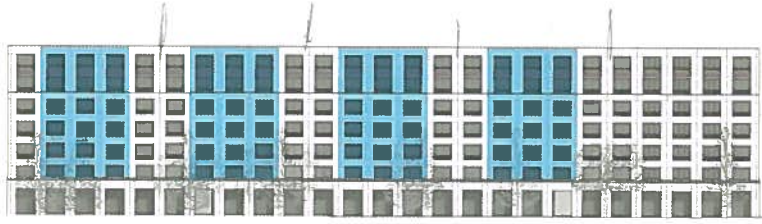
Ansicht West – Seite MFO-Park